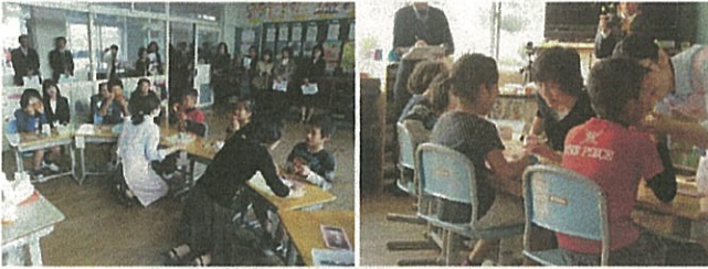
3・4年 歯の健康博士になろう