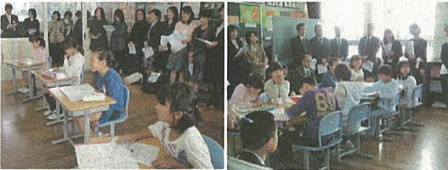
5・6年 家族の歯と口の健康を守ろう