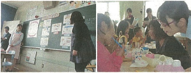
2年 歯ならびにあつたみがき方