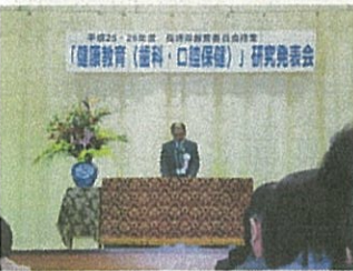
県教育委員会 ← 開会挨拶