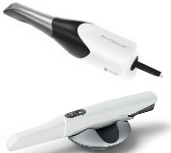
デジタル技工物の精度計測